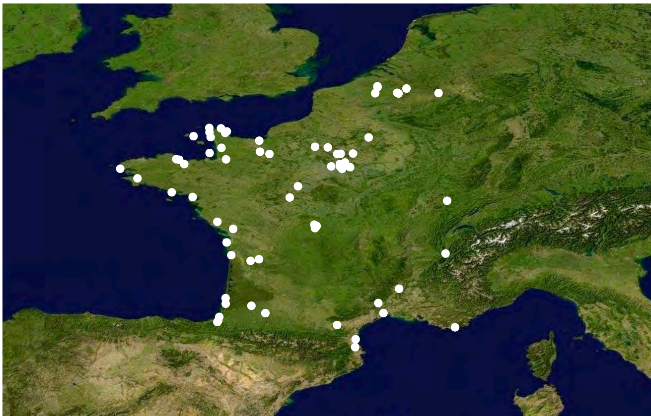
Figure 2. Synthèse des observations récentes de Stenoria analis (SCHAUM) en France et dans les régions voisines (fond de carte NASA)

emmenant sur un autre site où ils pourront interagir avec des hôtes naïfs (Mahé 2008). Ce phénomène pourrait expliquer pourquoi certains auteurs comme Mayet (1875) ou Moenen (2009) n'ont pas eu l'occasion d'observer les interactions entre C. hederæ et S. analis en conditions naturelles, alors que les mâles de l'abeille hôte étaient déjà activement à la recherche de leurs femelles et que les triongulins avaient probablement déjà été visités par certains mâles.